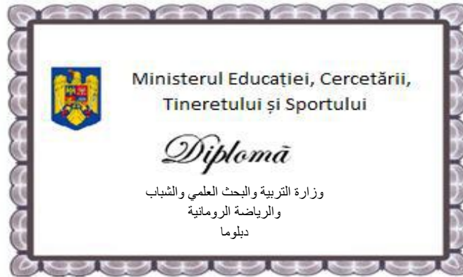
نموذج الشهادة الجامعية الرومانية

تصدر مؤسسات التعليم العالي في رومانيا الوثائق من شهادات ودبلومات وغيرها من الوثائق الحكومية الرسمية لاثبات التخرج من برامج التعليم العالي كما يمنح لقب اكايمي او مهني للخريج وفق نموذج الشهادة الجامعية الرومانية.